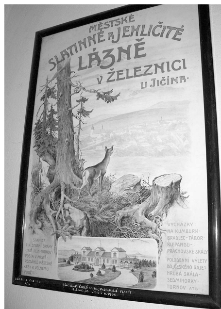
Propagační plakát z r. 1904 (autorem je Věnceslav Černý), který připomíná lázeňskou historii Železnice. Ze sbírek Muzea v Železnici.

A nejenom náměstí; i v okolních ulicích pro jednotlivé oblasti se začaly vytrácet. Rostoucí průmysl pohlcoval další součásti typického venkovského života - řemesla.