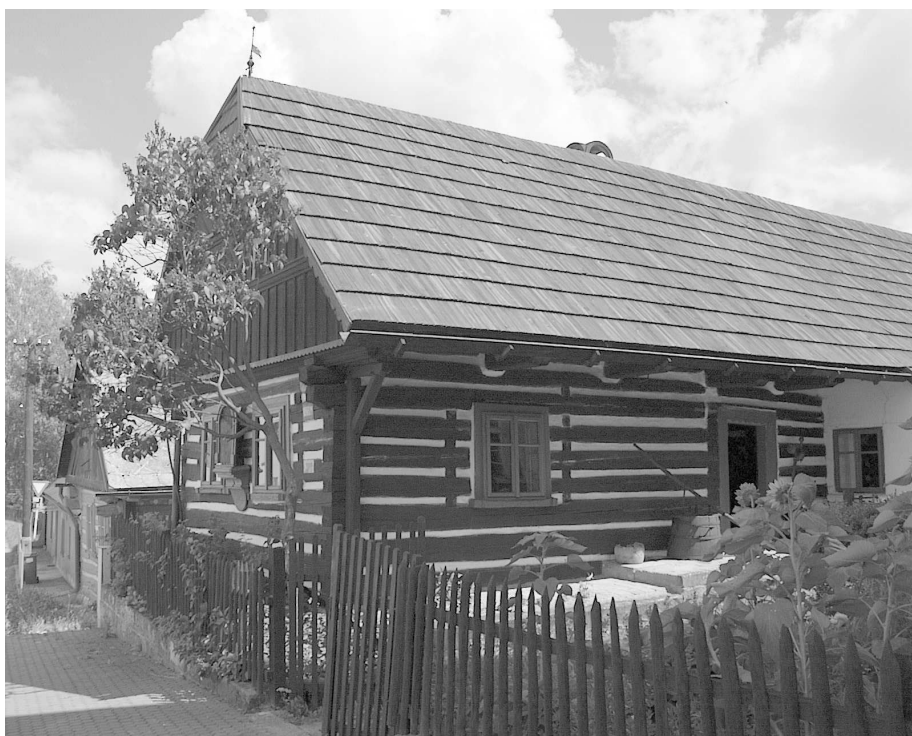
Roubená chalupa čp. 94, která je součástí muzea od r. 1941, kdy ji Muzejní spolek pro Železnici a okolí odkoupil za 20.000,- protektorátních korun.