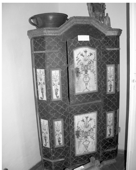
Typická malovaná skříň z 19. století. Ze sbírek Muzea v Železnici

V roce 1937 nastala v železnickém spolku významná událost, která předurčila jeho další rozvoj. Toho roku zemřel zakládající člen