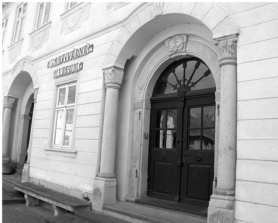
Empírový portál - vchod do železnického muzea

na sebevědomí. Jak si jinak vyložit návrh, aby muzea z okresu Jičín vystoupila ze Svazu československých muzeí a utvořila svaz vlastní? Pražské ústředí však Železnici a Jičínu, iniciátorům tohoto návrhu, tento úmysl rozmluvilo s tím, že podobné sdružení může fungovat i v rámci Svazu. Muzejní spolek byl nejenom sebevědomý, ale záhy se stal i velmi bohatým.