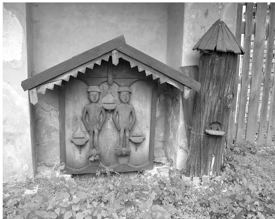
Úly – lidová řezba z 1. pol. 19. století. Železnické úly si zahrály ve dvou filmech – v Babičce a v Údolí včel .