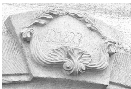
Architektonické detaily empírového slohu z budovy železničeského muzea, hlavice sloupu a vročení R1827.

výkonné pravomoci však byly v kompetenci ministerstva.